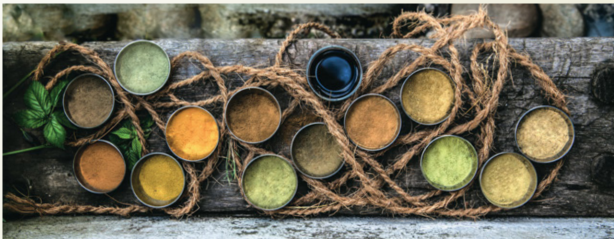
satuscolor PFLANZENHAARFARBEN von CULUMNATURA®

„Auf Nachfrage einiger meiner Kund:innen hin biete ich in meinem Salon auch satuscolor PFLANZENHAARFARBEN von CULUMNATURA® an, von denen ich regelmäßig begeistert bin. Meine Erfahrung zeigt, dass chemisch gefärbtes Haar eine chemische Pflege nach sich zieht. Eine Umstellung auf natürliche Produkte erfordert die Bereitschaft, das eigene Haar wieder heilen zu lassen.“